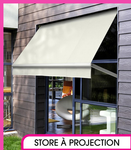
STORE À PROJECTION