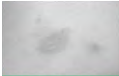
Maladies de la peau